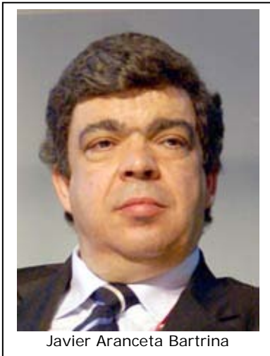
Javier Aranceta Bartrina

1.- Sin duda la obesidad es una enfermedad que está presente en todo el mundo. ¿Cree que se están tomando medidas adecuadas en España para combatirla?